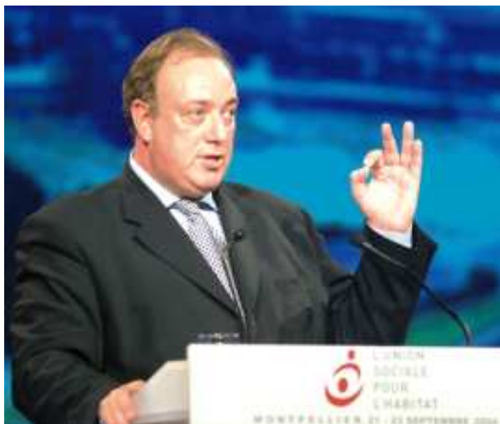
Intervention de Marc-Philippe DAUBRESSE au Congrès de l'Union Sociale pour l'Habitat à Montpellier en Septembre 2004.

Faire de ce nouveau dispositif un prêt "plus social et plus familial", voilà l'objectif du Secrétaire d'Etat au logement, Marc-Philippe Daubresse, qui projette de doubler le nombre de primo-accédants, pour atteindre les 240 000 par an.